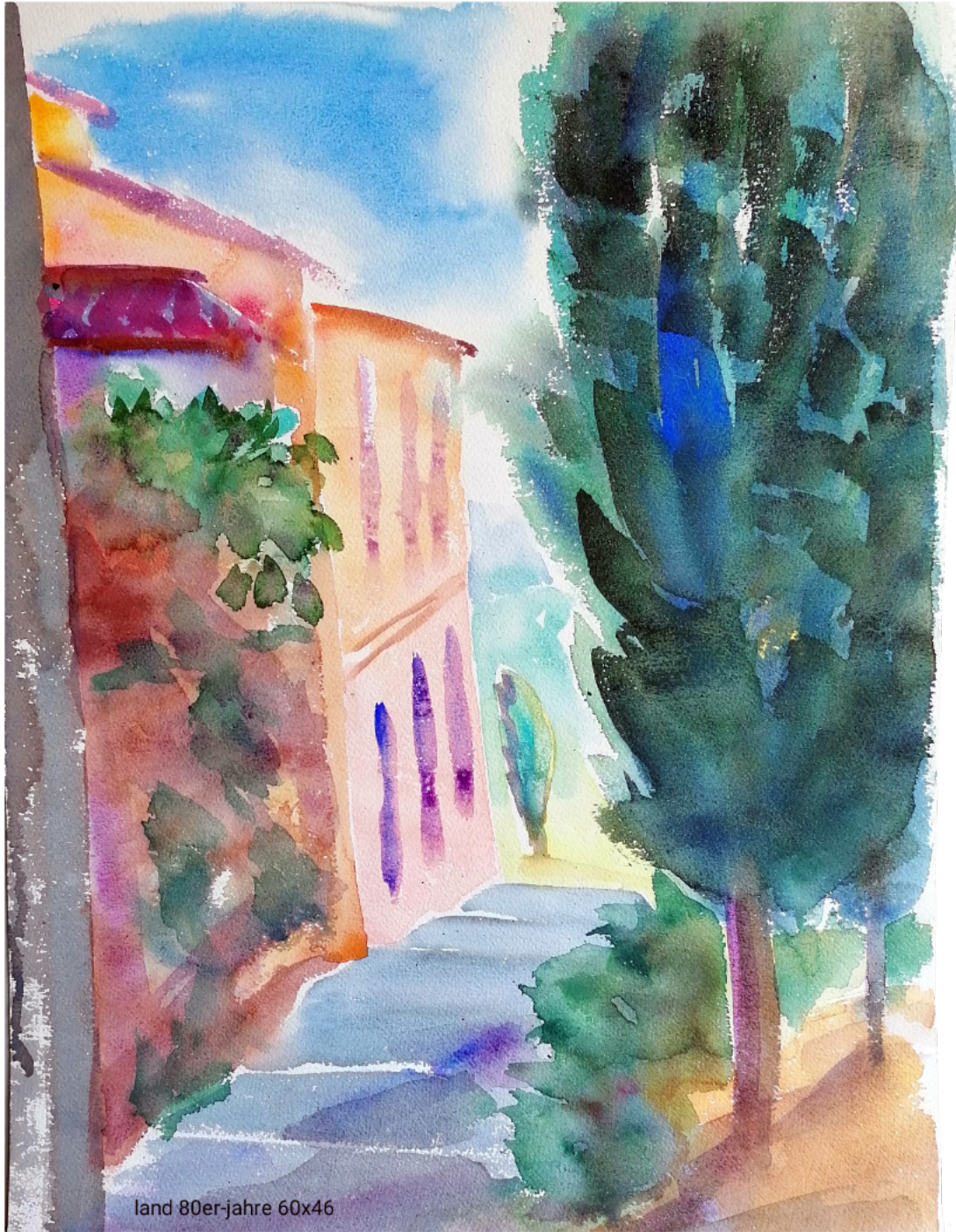
land 80er-jahre 60x46