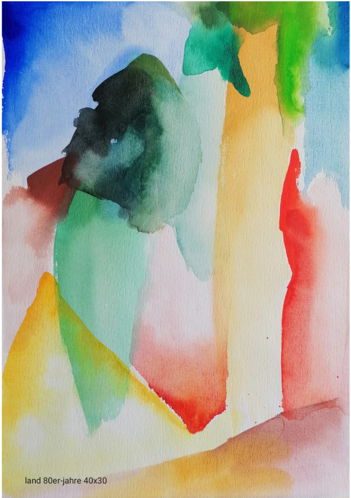
land 80er-jahre 40x30