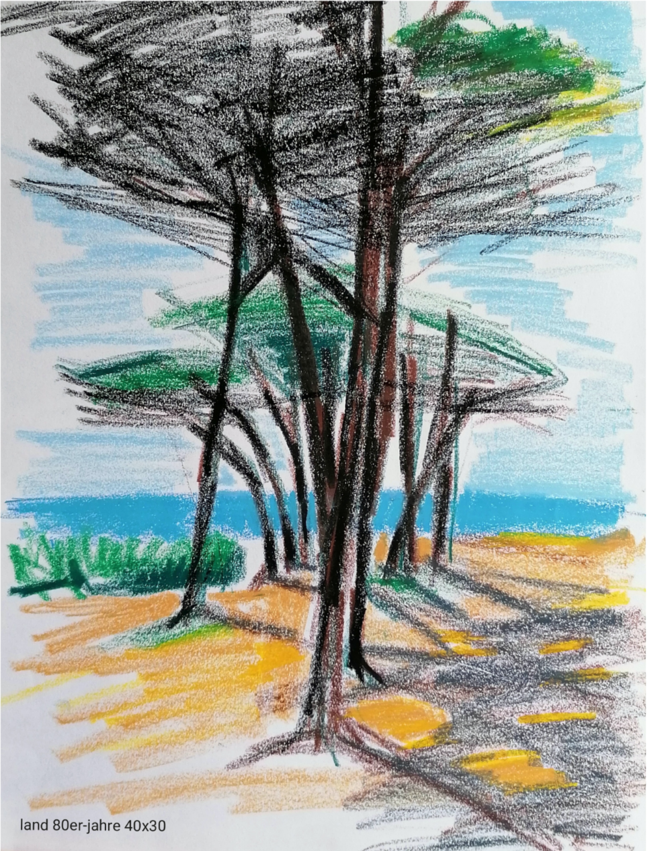
land 80er-jahre 40x30