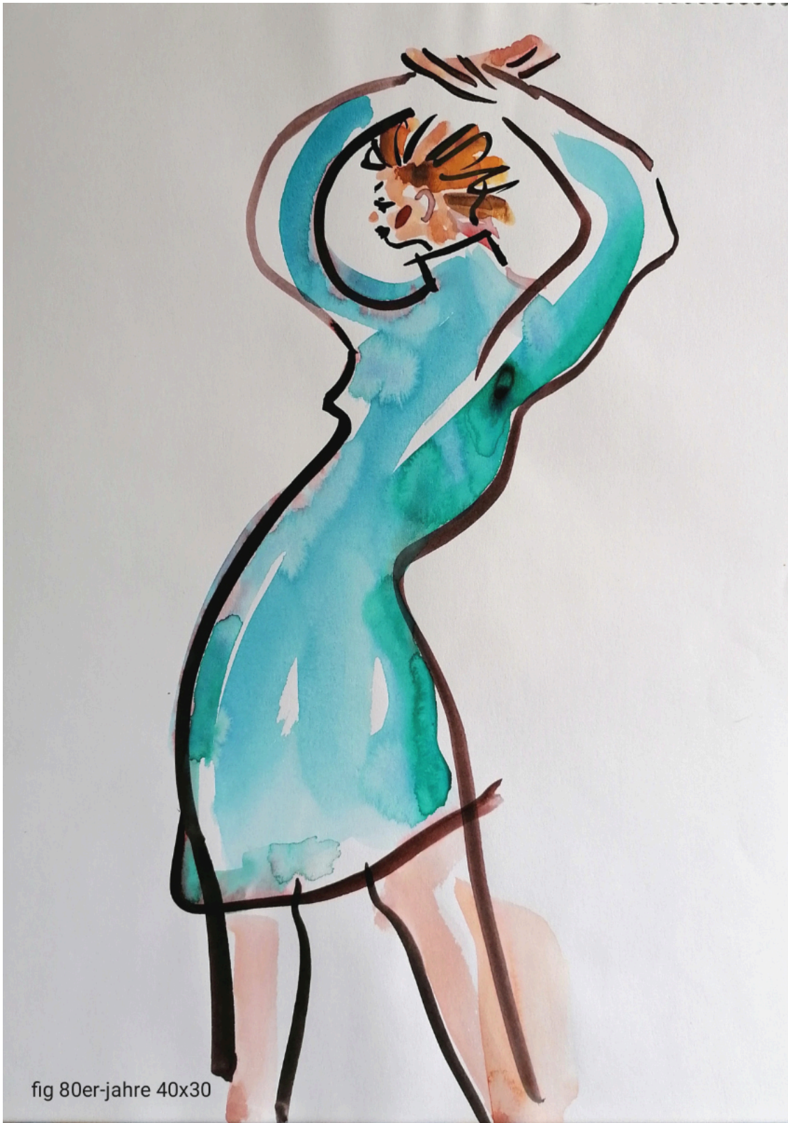
fig 80er-jahre 40x30