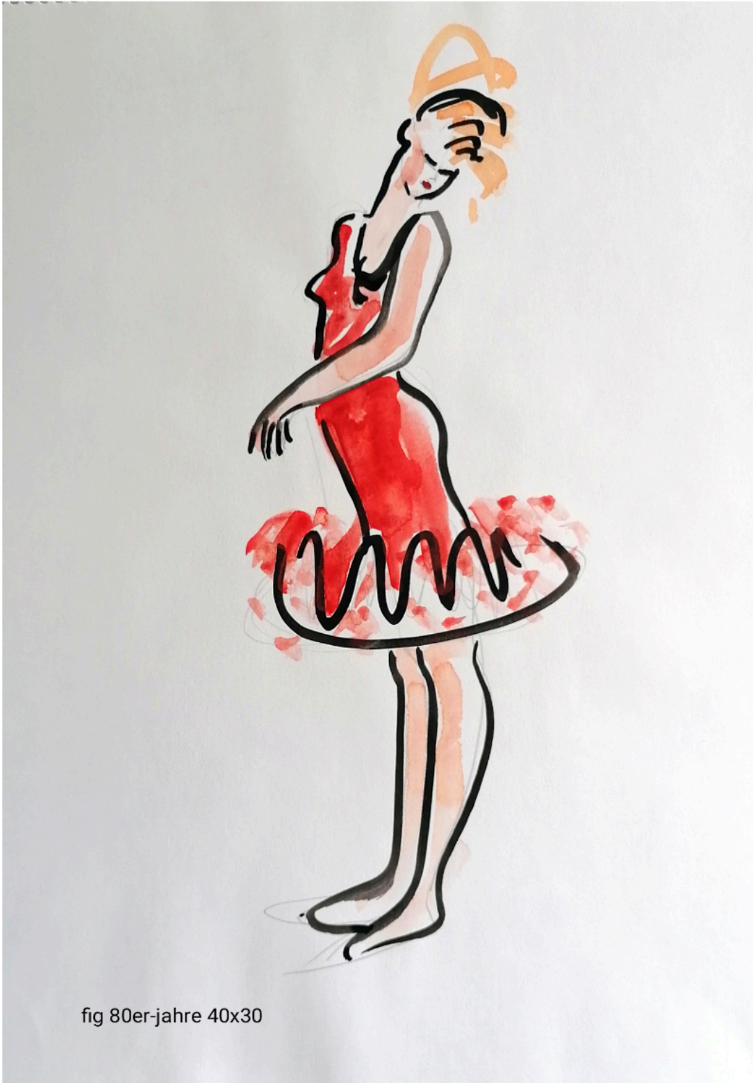
fig 80er-jahre 40x30