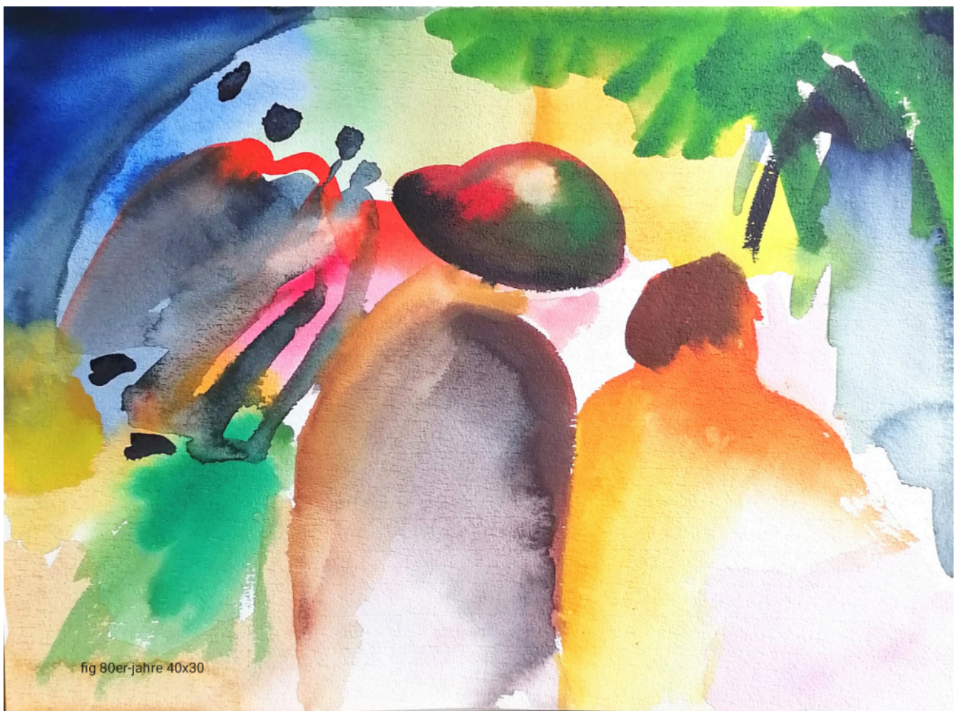
fig 80er-jahre 40x30