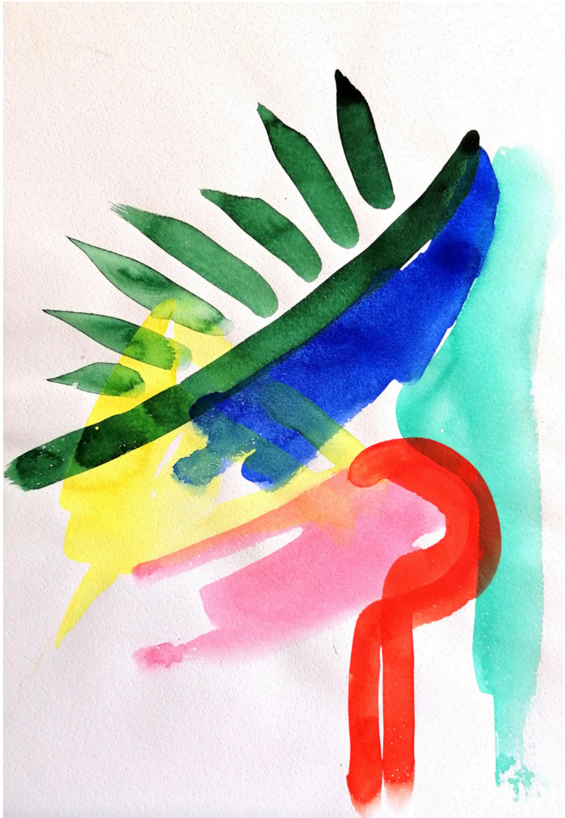
o. T. Aquarell 34 x 24 cm