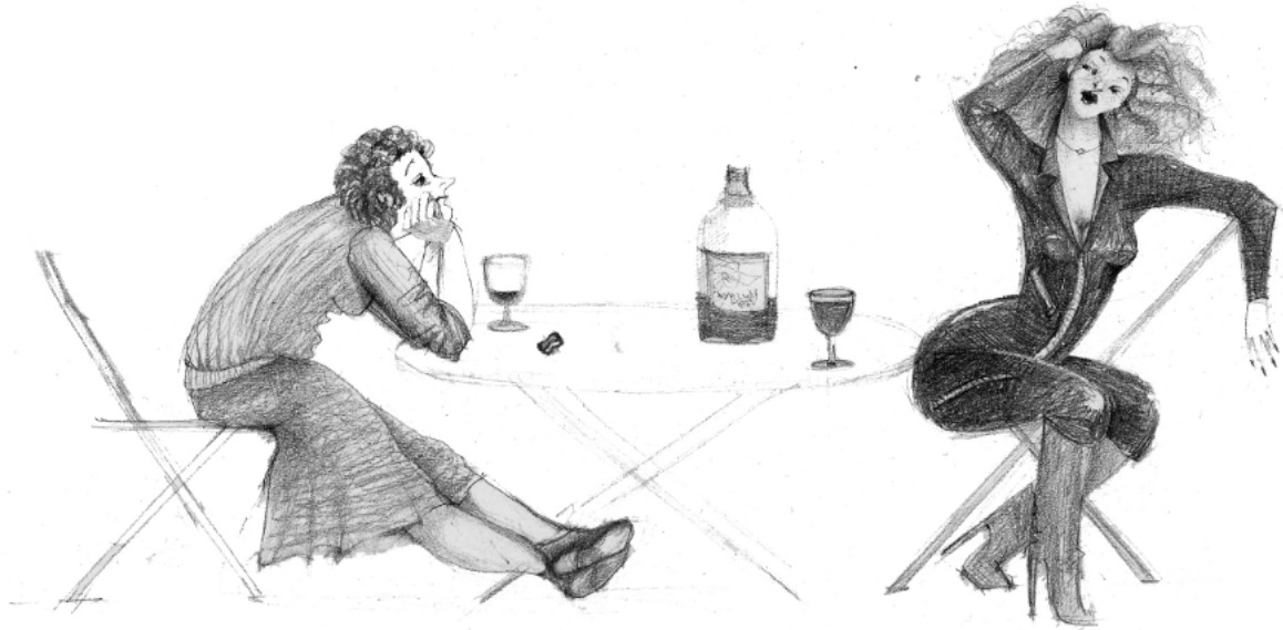
Besuch der Freundin