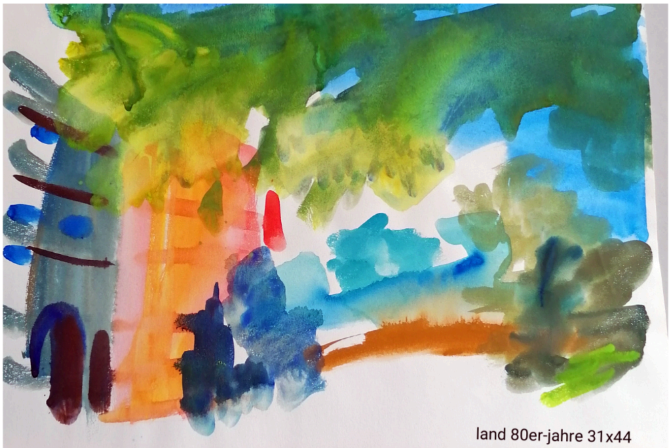
Toscana - Aquarell 31-x 44 cm