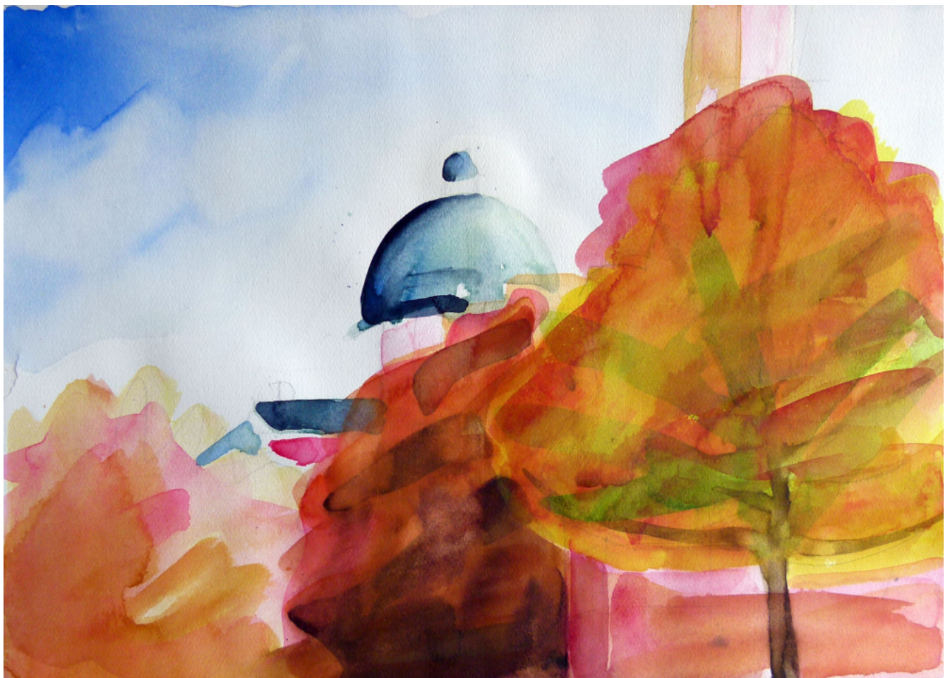
St. Ursula - Aquarell 30 x 40 cm